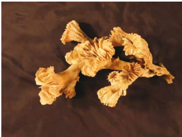
Figura 9. Heterocyathus aequicostatus Milne Edwards y Haime, 1848 (USNM 97001, diámetro de cáliz 5 mm)