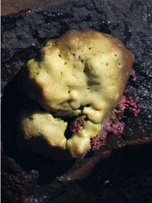
Figura 1. Porites panamensis Verrill, 1866 (diámetro de cáliz 1 mm)