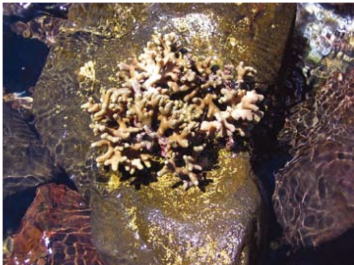
Figura 3. Astrangia cortezi Durham, 1947 (diámetro de cáliz 5.5 mm)