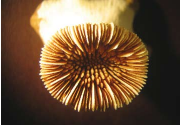
Figura 11. Phyllangia consagensis (Durham y Barnard, 1952) (USNM 93143, diámetro de cáliz 10 mm).