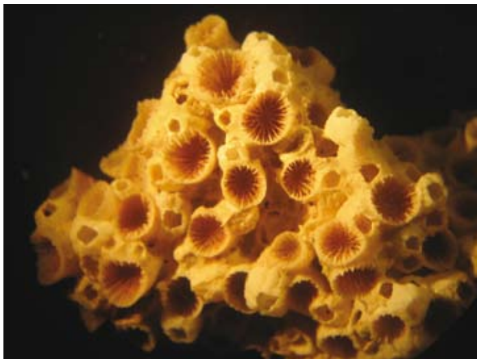
Figuraa 5. Oulangia bradleyi Verrill, 1866 (USNM 83585, diámetro de cáliz 14 mm).